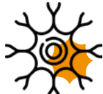
Neubildung von Nervenfasern